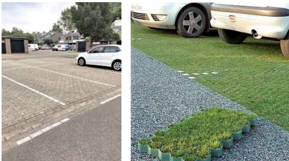
foto1: Betegelde parkeerpleinen Vredenburg en foto2: Grasroosters

Duurzame, betaalbare oplossingen zijn er. Bijvoorbeeld, grastegels/-roosters, die regenwater doorlaten in de grond, zodat het niet nodeloos wordt afgevoerd in de straatputten. Zo zijn groene grastegels/-roosters een prima oplossing voor de grauwe geasfalteerde of betegelde parkeerstroken/-pleinen. Er zijn meer mogelijkheden om onze woonwijk klimaatbestendig te maken. Maar het zou te ver voeren om hier daarop verder in te gaan. Hier willen wij graag pleiten voor een klimaatplan voor onze wijk (wijkklimaatplan), dat in samenspraak met onze wijkbewoners wordt opgesteld. Dat zou een mooie opgave zijn voor het komende wijkprogramma 2020.