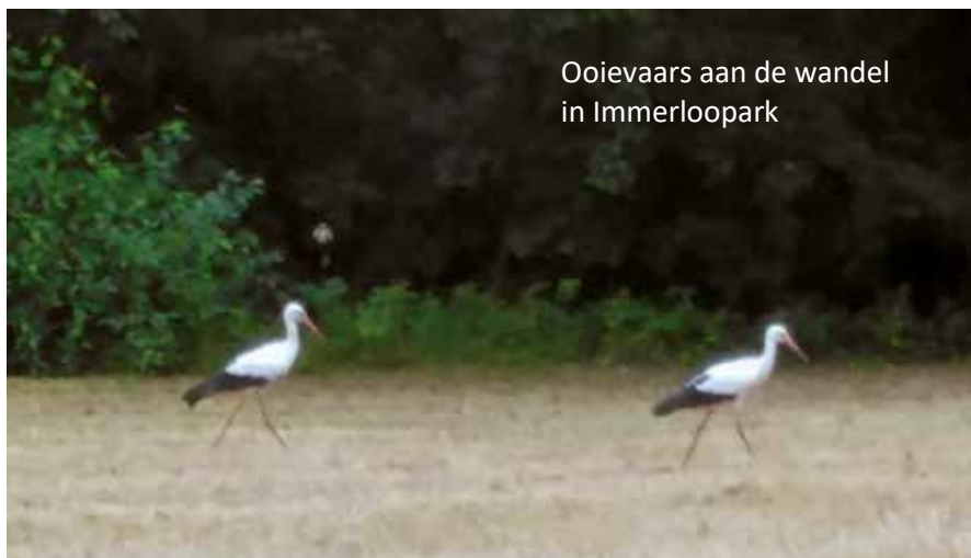
Ooievaars aan de wandel in Immerloopark

Het volgend Bewonersoverleg is op woensdag 30 oktober om 20.00 uur in de Vredenburg.