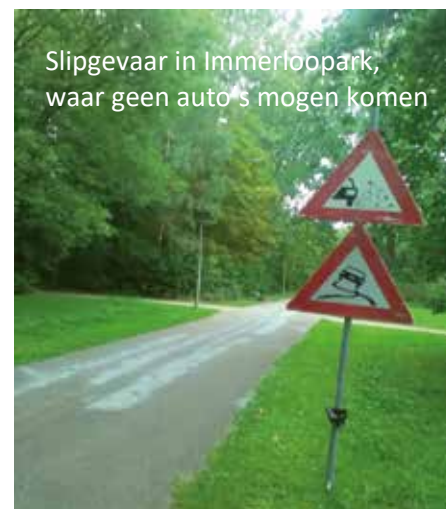
Slipgevaar in Immerloopark, waar geen auto's mogen komen